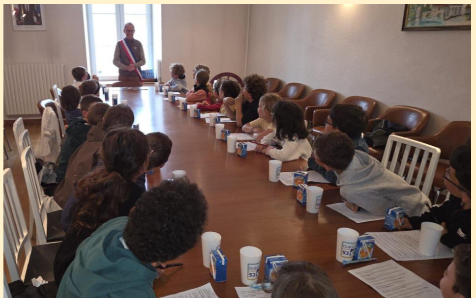
La classe des CE2 a également été attentive aux réponses formulées

À l'issue de cette rencontre, chaque élève est reparti avec une boisson ainsi qu'un écocup aux couleurs de la commune.