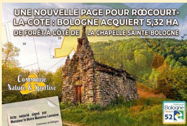
La Chapelle Sainte-Bologne est un lieu emblématique sur la commune

Plusieurs projets sont actuellement à l'étude. Ils seront prochainement définis par la commission « cadre de vie », puis validés par le conseil municipal.