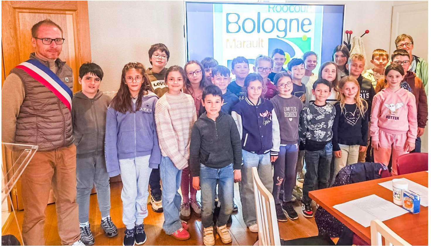
Photo de groupe avec les élèves de CMI

Lundi 4 mai, deux classes de l'école Victor Hugo sont venues à la rencontre de Monsieur le Maire pour l'interroger sur des sujets qu'elles avaient choisis. Très apprécié, cet échange a mêlé questions préparées et interventions spontanées, au fil de la discussion.