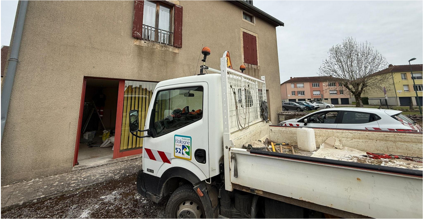
Implantée à un endroit stratégique, cette médiathèque profitera d'une meilleure visibilité

Un nouvel espace de vie ouvert à tous verra le jour. Petits et grands pourront s'y retrouver autour de la lecture, d'activités collectives et de jeux vidéo.