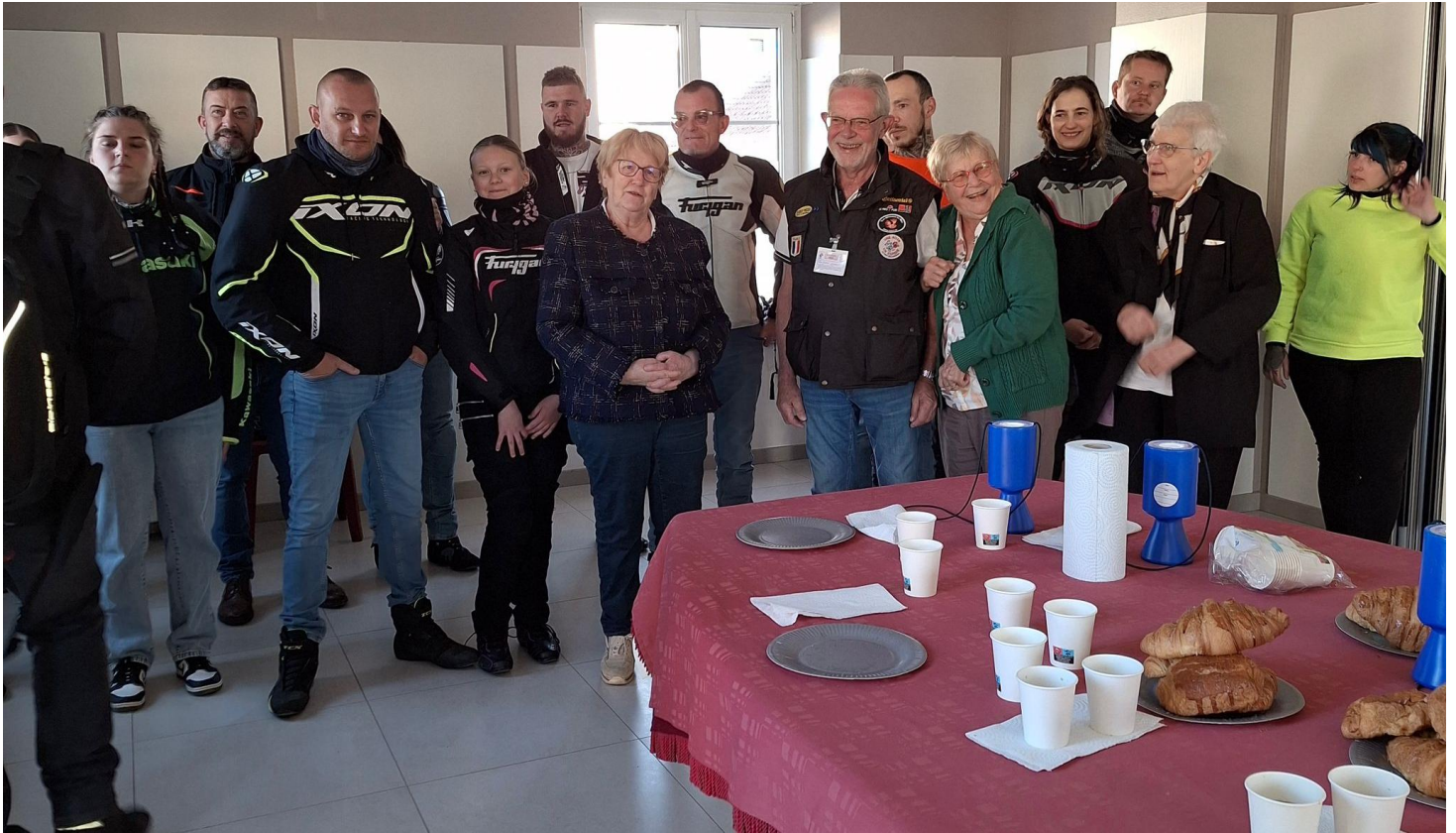
La commune a pris part à cette initiative en achetant 50 roses et en offrant le petit-déjeuner aux motards

Le week-end des 25 et 26 avril, les motards du secteur se sont mobilisés pour l'opération « Une Rose Un Espoir 52 ». Ils ont parcouru la commune afin de récolter des dons en faveur de la lutte contre le cancer.