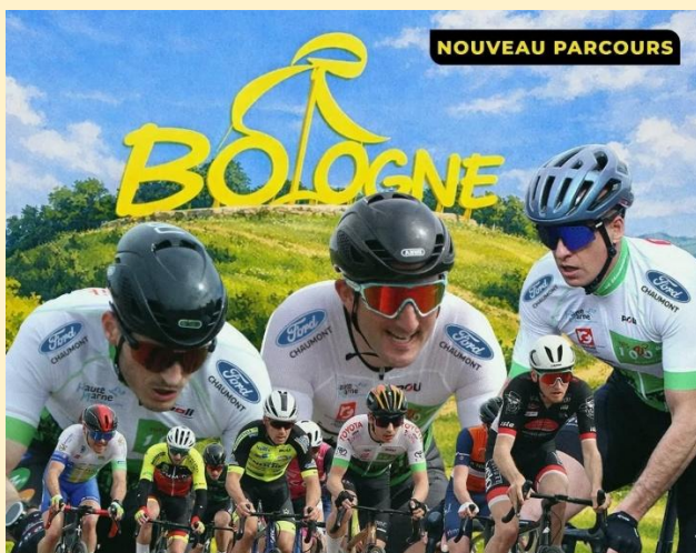
L'affiche de la 26 ème édition