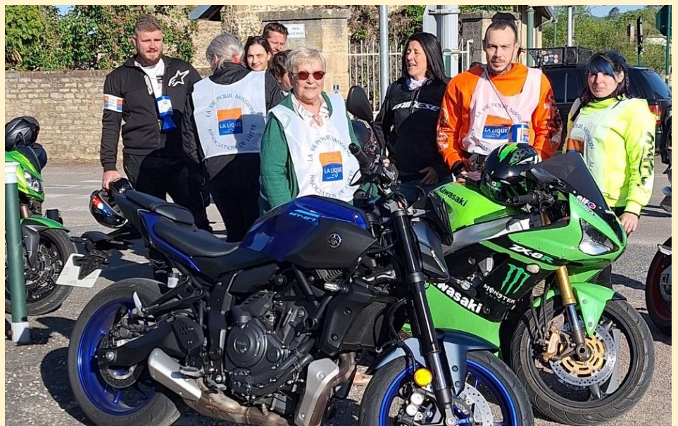
Le bruit des moteurs a raisonné pour la bonne cause