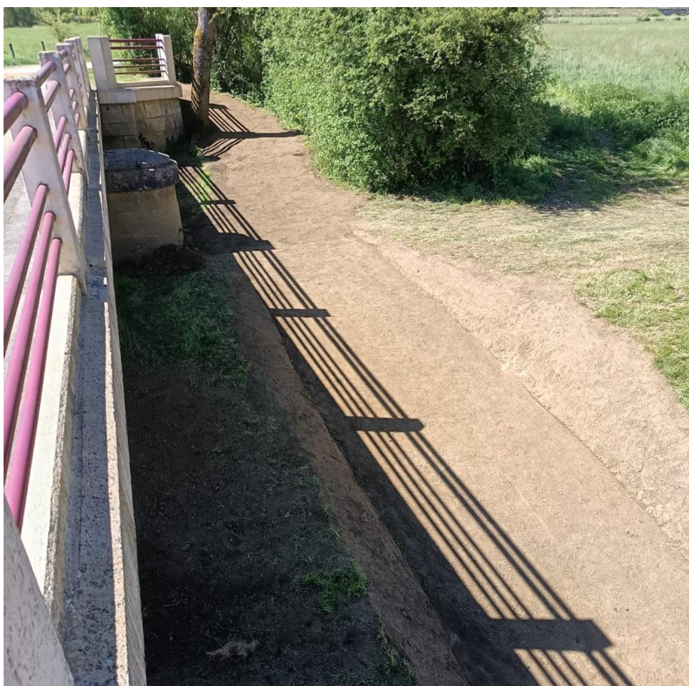
Les travaux sont là encore réalisés en régie par nos services techniques

Situé à proximité du Parcours Famille du Pont Rouge, le site bénéficiera d'un accès facilité de part et d'autre du pont afin d'en améliorer l'accessibilité.