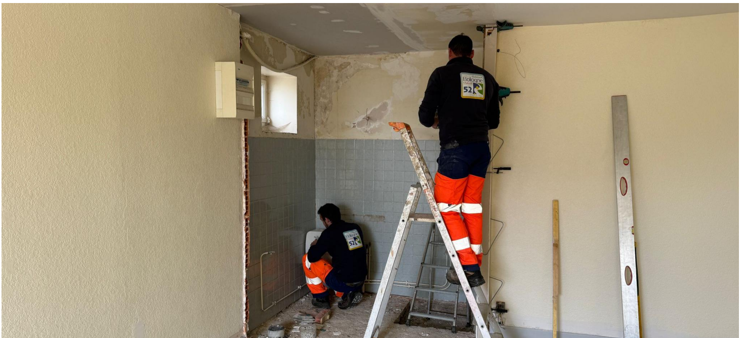
Elle constituera également un support pédagogique utile pour les élèves des écoles maternelles et élémentaires