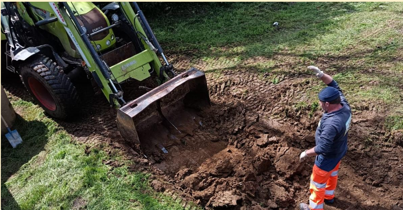
À Roëcourt-la-Côte, un projet d'aménagement d'une zone de baignade non surveillée en bord de Marne est en cours de réalisation