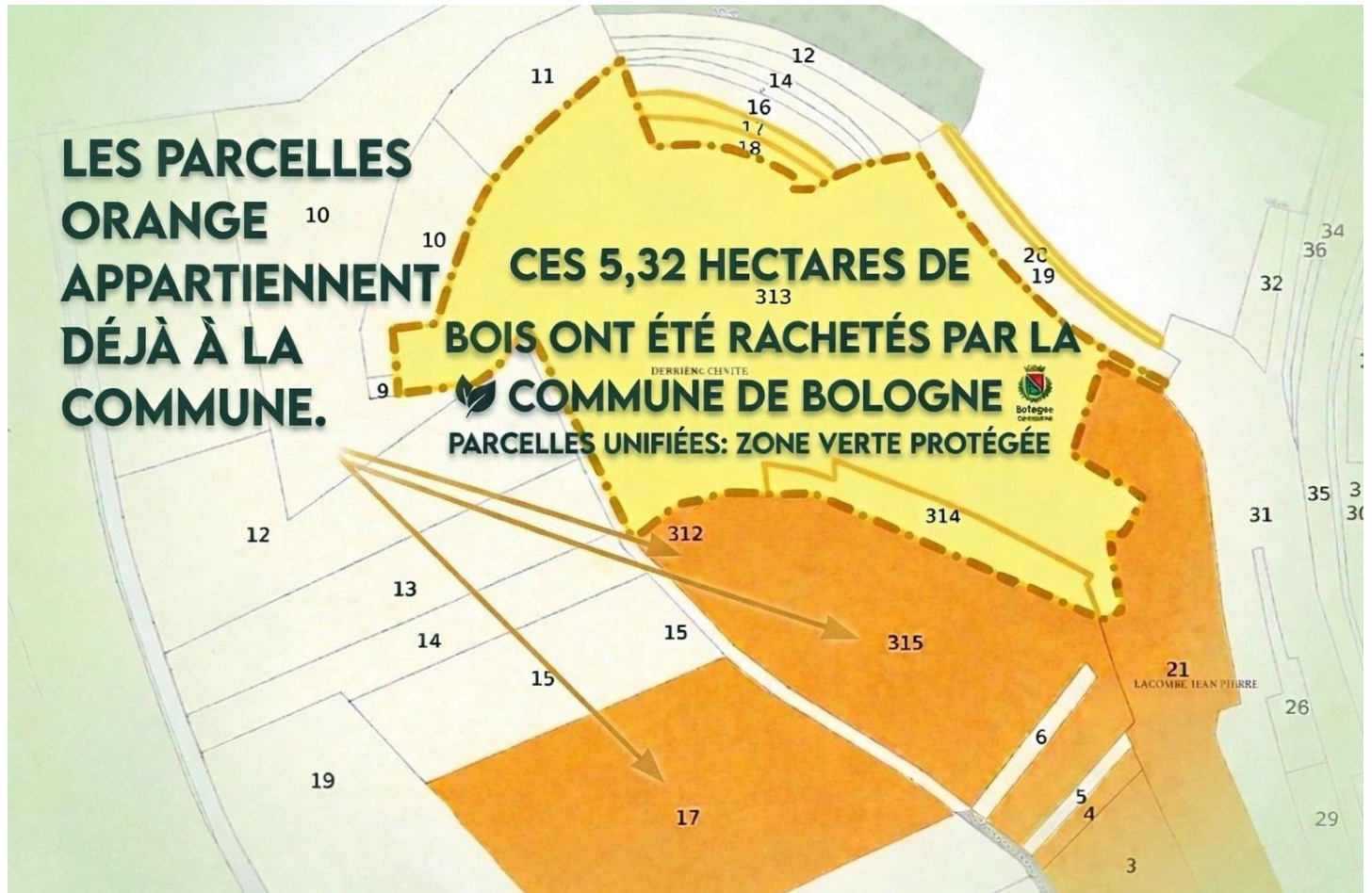
Une acquisition souhaitée par les élus de Roôcourt-la-Côte

Une étape majeure qui marque une avancée concrète pour renforcer l'attractivité du territoire et valoriser ce site naturel d'exception.